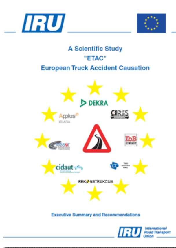
Figura nr.6: IRU-licensa