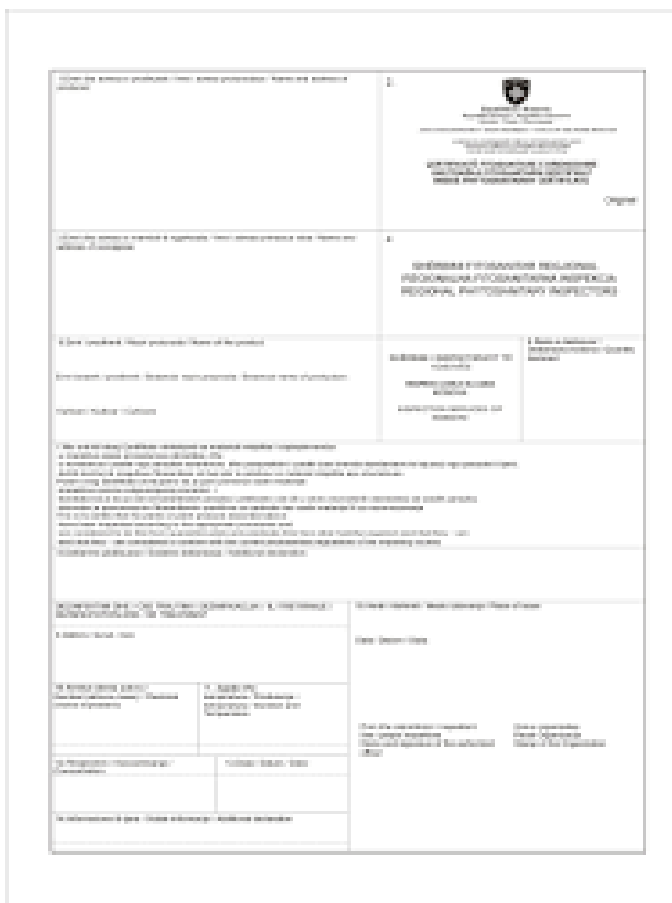
Figura nr. 3: Certifikata për origjinën e mallrave